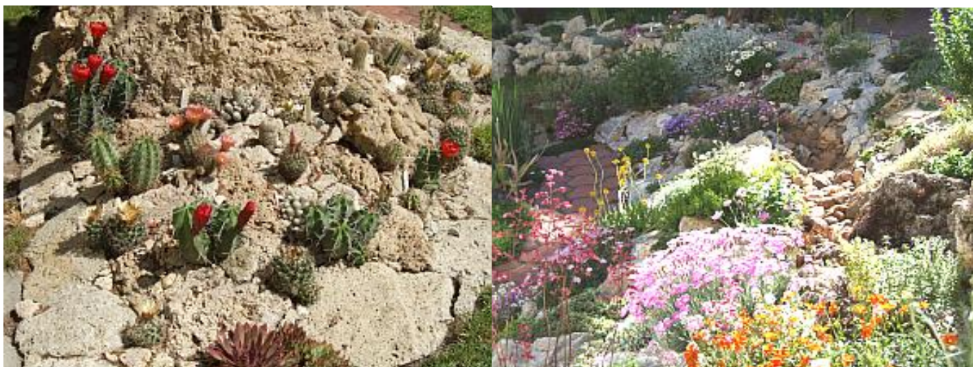
Télálló kaktuszok forrás mésztufában.