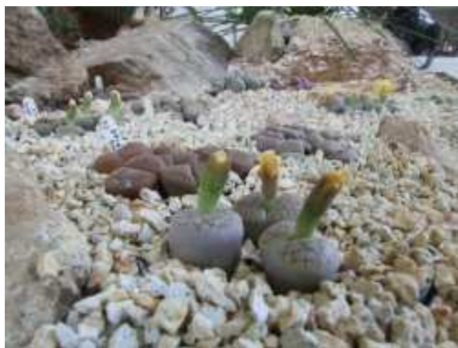
Ficzere Miklós képei a tavalyi kiállítás sziklakertjéről.