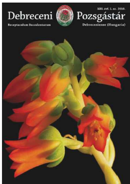
A Debreceni Pozsgástár 2010/1 számának borítója.